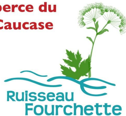
Figure 2 : Image graphique