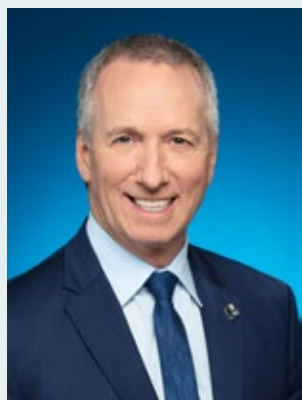
Ministre de l'Agriculture, des Pêcheries et de l'Alimentation

J'ai eu l'occasion d'échanger avec les représentants des pêcheurs et des transformateurs au sujet de la crevette. Ma volonté est de continuer d'accompagner les entreprises du secteur affectées par la situation et de trouver des solutions ensemble.