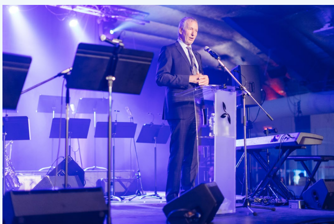
Le ministre de l'Agriculture, des Pêcheries et de l'Alimentation, M. André Lamontagne, lors de son allocution à l'École des pêches et de l'aquaculture du Québec.

L'un des moments forts de cette visite était la célébration du 75 e anniversaire de l'École des pêches et de l'aquaculture du Québec. En tant que président d'honneur du banquet célébrant cet anniversaire, le ministre Lamontagne a prononcé un discours devant l'ensemble des invités et n'a pas manqué de souligner l'importance de l'École et de sa contribution au secteur des pêches et de l'aquaculture.