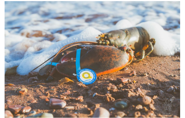
Homard identifié par le médaillon bleu du RPPSG

Pour une douzième année consécutive, le Regroupement des pêcheurs professionnels du sud de la Gaspésie (RPPSG) a mis de l'avant l'initiative d'identification des homards de la Gaspésie à l'aide de son médaillon bleu. Ce dernier permet d'identifier la provenance ainsi que le pêcheur grâce au numéro qui y est inscrit.