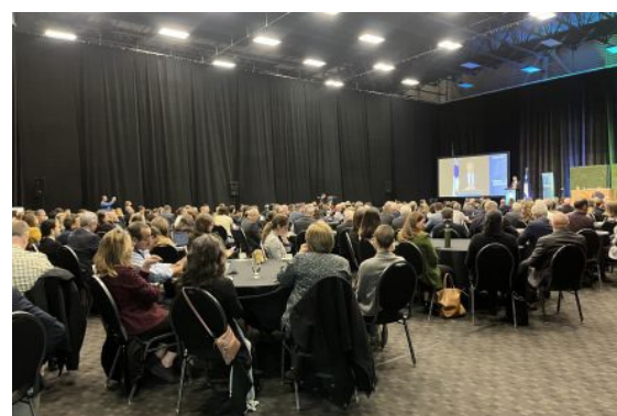
La salle était comble à la 4 e rencontre annuelle de la Politique bioalimentaire.

Cette quatrième rencontre des partenaires s'est déroulée sur le thème « Fiers d'alimenter l'économie durable du Québec ». Les nombreux échanges ont porté sur l'entrepreneuriat jeunesse, l'innovation et l'attractivité, des facteurs qui peuvent inciter les