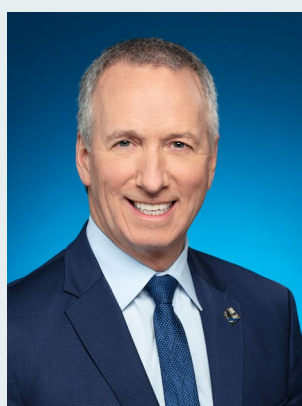
Ministre de l'Agriculture, des Pêcheries et de l'Alimentation

Dans un autre ordre d'idées, je tiens à accueillir chaleureusement ma collègue fédérale, la nouvelle ministre des Pêches, des Océans et de la Garde côtière canadienne, M me Diane Lebouthillier.