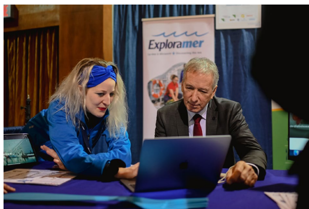
Explication de la plateforme numérique au ministre André Lamontagne lors du salon Fourchette bleue 2023

En mars 2023, Exploramer organisait pour la deuxième année le salon Fourchette bleue – poissons et fruits de mer, qui a pour objectif de permettre aux acheteurs québécois d'avoir un plus grand accès aux produits d'ici. Par rapport à la première année, c'est près du double des exposants qui étaient présents à cette deuxième édition, en plus des nombreux acheteurs potentiels qui ont visité le salon. De plus, toujours dans le cadre de l'initiative Fourchette bleue, Exploramer a lancé cette année une plateforme numérique qui vise à mettre à la disposition de l'industrie de la pêche un outil permettant de mailler acheteurs et vendeurs de petits volumes de produits marins du Québec.