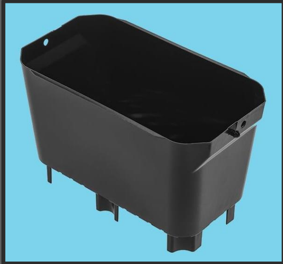
Pot de 1,85 L