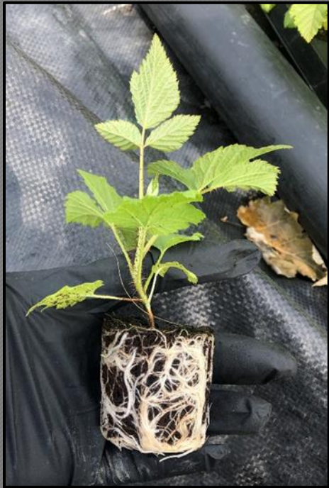
Plants mottes (G0)