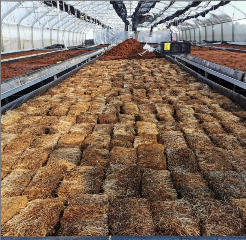
Racines sont sorties de la chambre froides et placées en serre