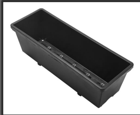
Pot de 8 L