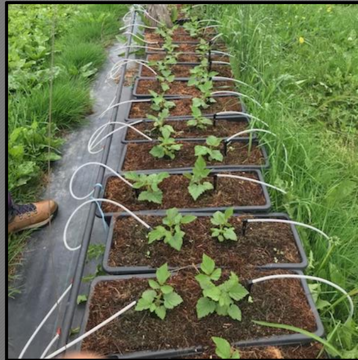
G0 plantés en pépinière en substrat de fibre de coco