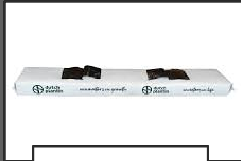
Sac de 12 L