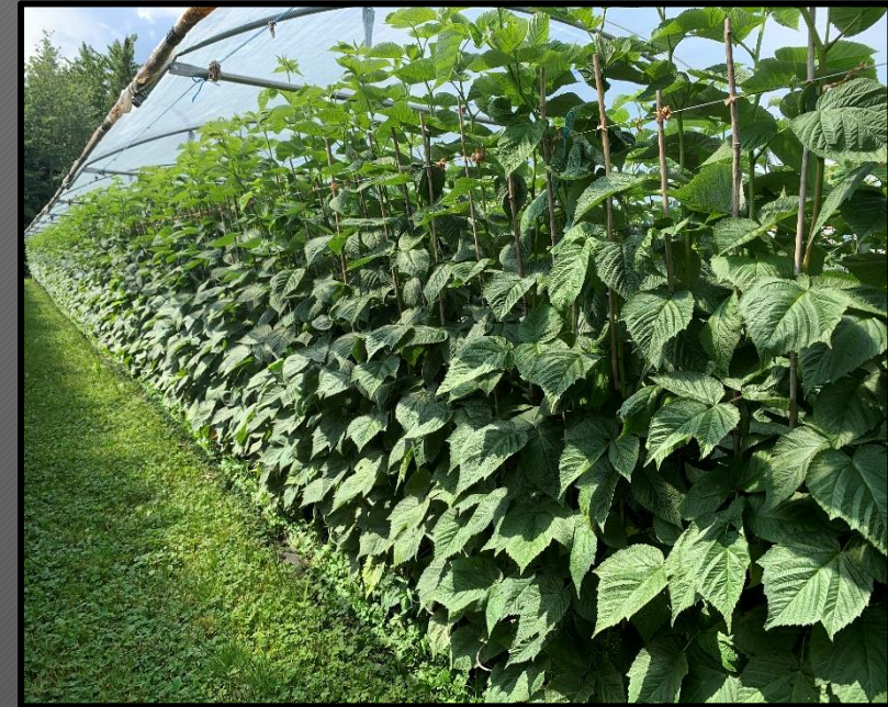
Production de racines en cultivant les longues cannes