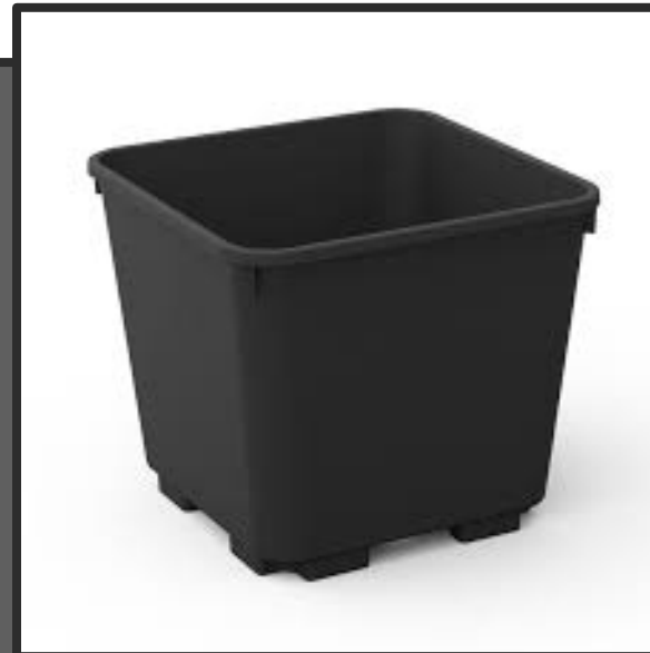
Pot de 4,7 L