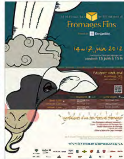
Festival des fromages fins de Victoriaville Les ingrédients d'un bon festival fromager