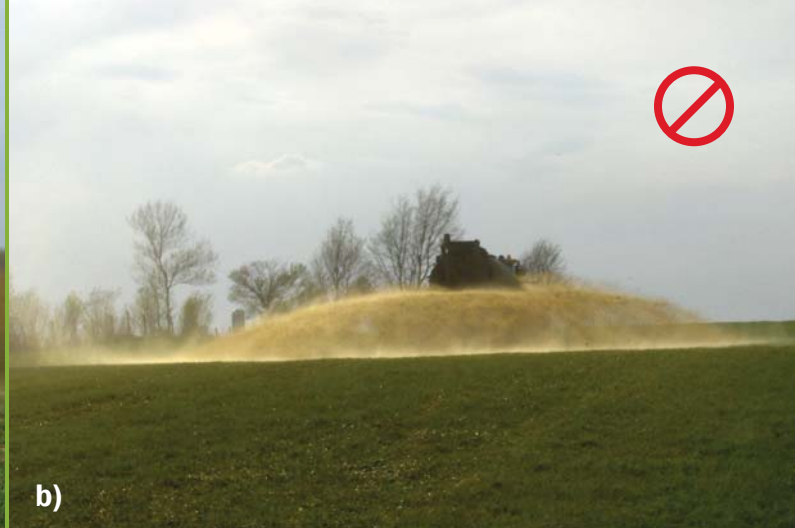
Figure 2 : À éviter. Formation de bruines lors de l'épandage de lisiers clairs par aéroaspersion basse. a) à la sortie de l'épandeur; b) à l'impact du lisier au sol.

de réduire le débit d'épandage. Et grâce à leurs jets multiples et espacés, les rampes peuvent maintenir un patron d'épandage plus uniforme sur une certaine largeur lorsque le débit est réduit.