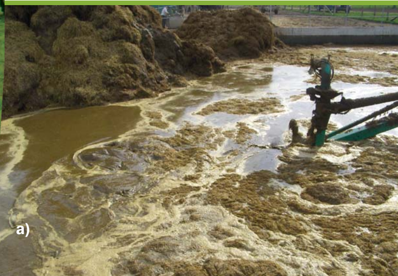
Figure 5 : Pailles flottant à la surface d'un lisier clair. a) dans la fosse; b) dans la citerne d'épandage.

Les producteurs qui ne disposent pas de l'équipement nécessaire pour réaliser un bon brassage peuvent envisager diverses formules de partage de machinerie, ou engager des entreprises d'épandage à forfait.