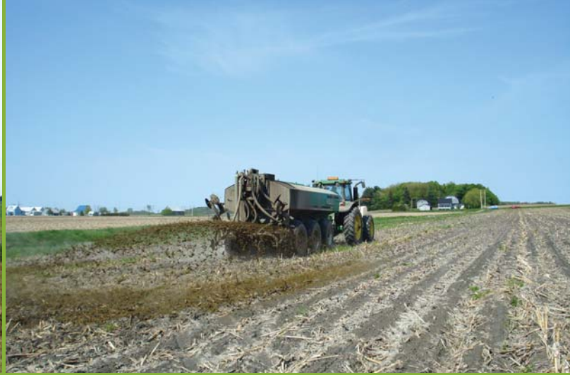
Figure 1 : Épandage par aéroaspersion basse de lisiers de bovins pailleux à contenu élevé en matière sèche.